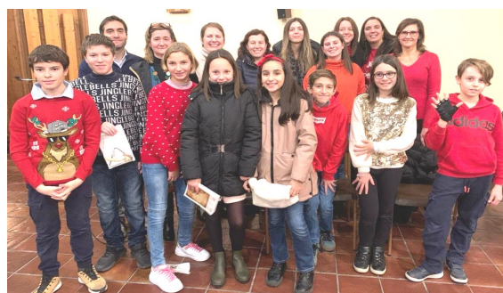
Coretto del Santuario e gruppo chitarre di Cassina